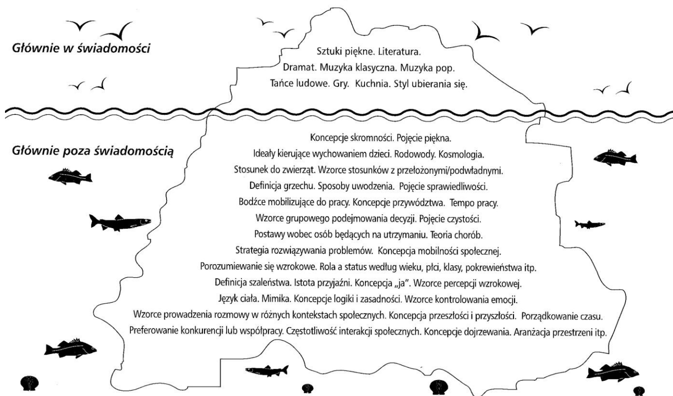
Rys. 1: Koncepcja kultury jako góry lodowej